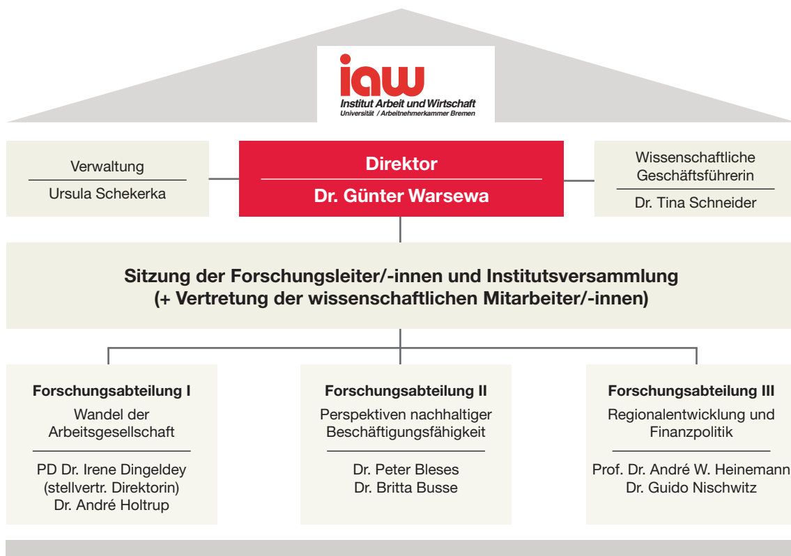
Abbildung 1: Organisationsstruktur des iaw

„Qualifikationsforschung und Kompetenzerwerb“ zur aktuellen Forschungsabteilung „Perspektiven nachhaltiger Beschäftigungsfähigkeit“. Damit hat das iaw nunmehr eine einfache, nachvollziehbare und zukunftsfähige Institutsstruktur aus drei etwa gleich großen Abteilungen, die jeweils alle Kompetenzen und Kapazitäten zur Bewältigung der Aufgaben einer wissenschaftlichen Forschungsabteilung umfassen. Mit dem Prozess der Konzentration und Bündelung von Arbeitsthemen und Forschungskapazitäten in den drei Forschungsabteilungen im iaw wurden wichtige Voraussetzungen für die wissenschaftliche Produktivität ebenso wie für erfolgreiche Drittmittelwerbungen deutlich verbessert, zum Beispiel eine Jahresplanung für die Forschungsabteilungen eingeführt. Die diversen Einzelmaßnahmen, die in diesem Prozess beschlossen wurden, wurden im iaw intensiv mit allen Mitarbeiterinnen und Mitarbeitern diskutiert; diesem Zweck diente eine interne Arbeitsgruppe zur Organisationsentwicklung, die von 2011 bis 2015 tätig war und ihre Arbeitsergebnisse regelmäßig institutsöffentlich zur Diskussion stellte, sowie zwei ein-tägige Institutsklausuren in den Jahren 2012 und 2014.