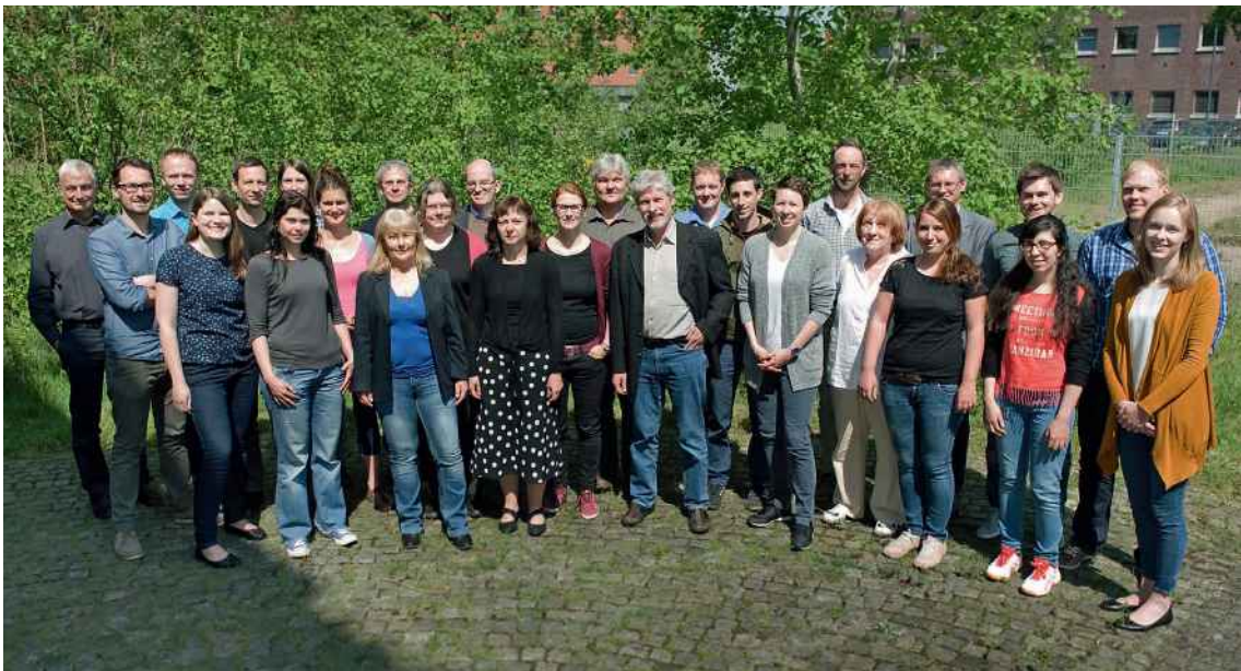
Abbildung 3: Mitglieder des iaw 2016 (nicht vollständig)